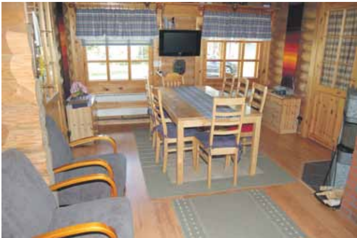
Olohuone jossa mm. takka ja TV.