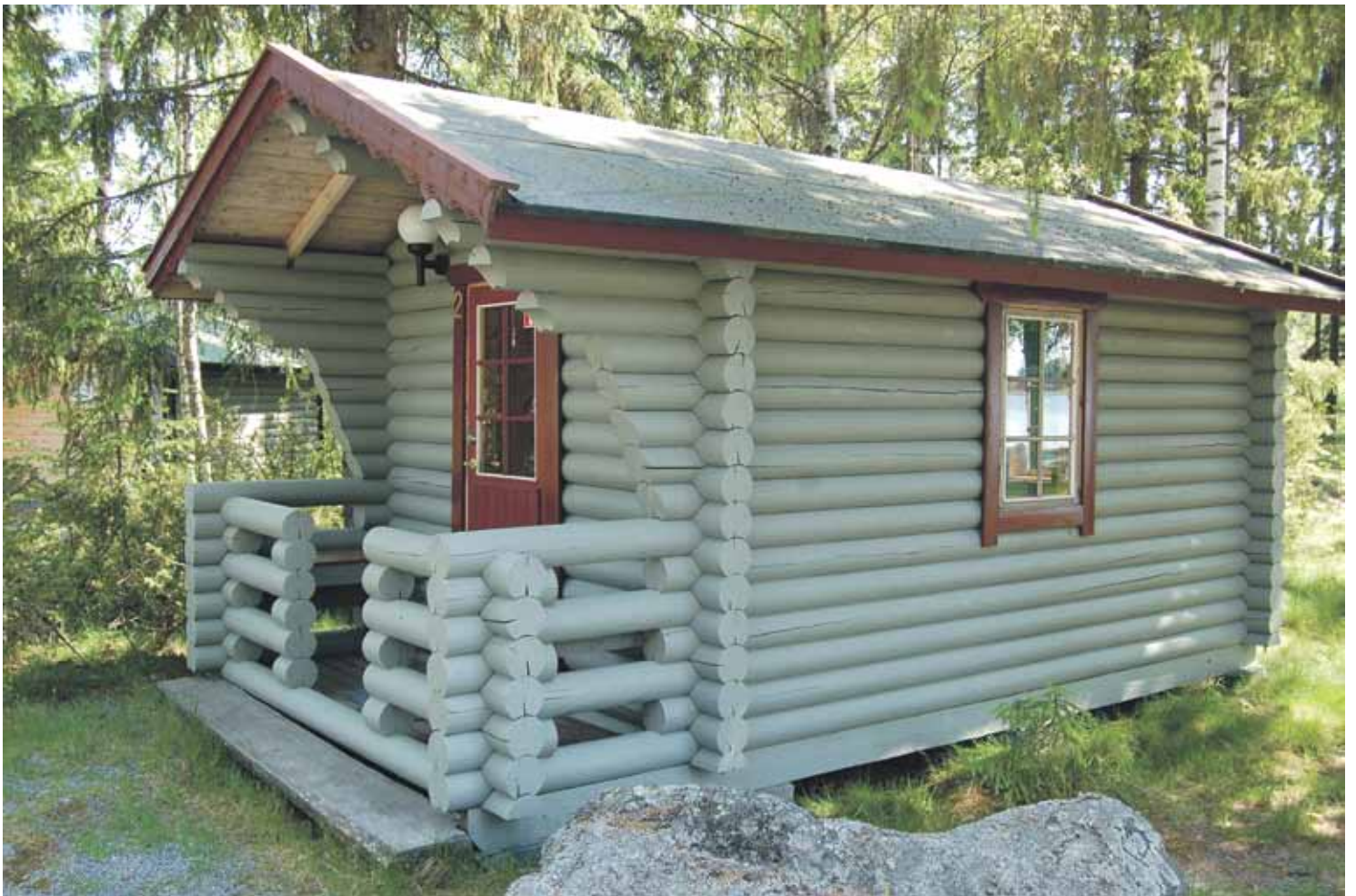
Pieni yöpymismökki nro: 2 varustus: Levitettävä parivuode, vaatekaappi, jääkaappi, kahvinkeitin. (sijainti saunan vieressä)