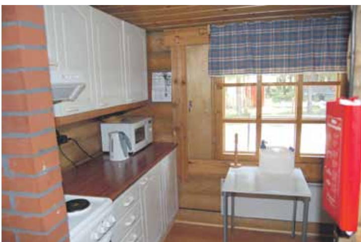
Hyvin varustettu keittiö asioineen