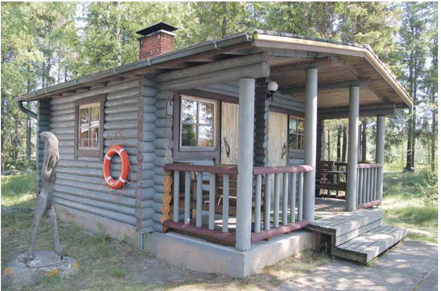
SAUNA puulämmitteinen kunnan sauna aivan rannassa josta helppo käväistä uimassa. Saunassa on myös takahuone.