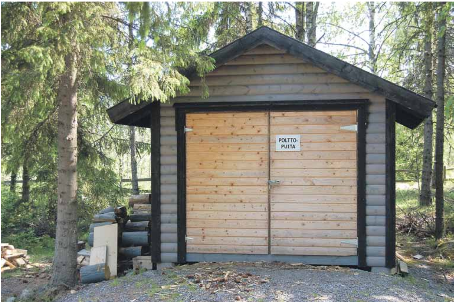
Täältä löydät valmiiksi pienistetyt polttopuut saunaan tai grillikatokseen.