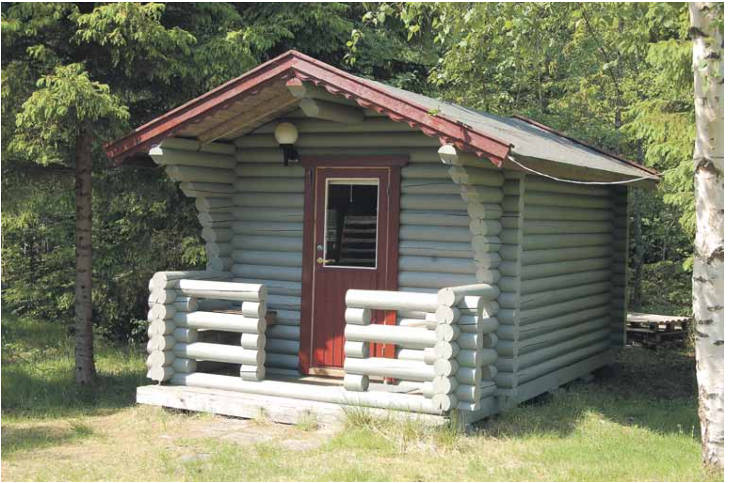
Pieni yöpymismökki nro: 1 varustus: Levitettävä parivuode, vaatekaappi, jääkaappi, kahvinkeitin. (sijainti metsän reunassa)