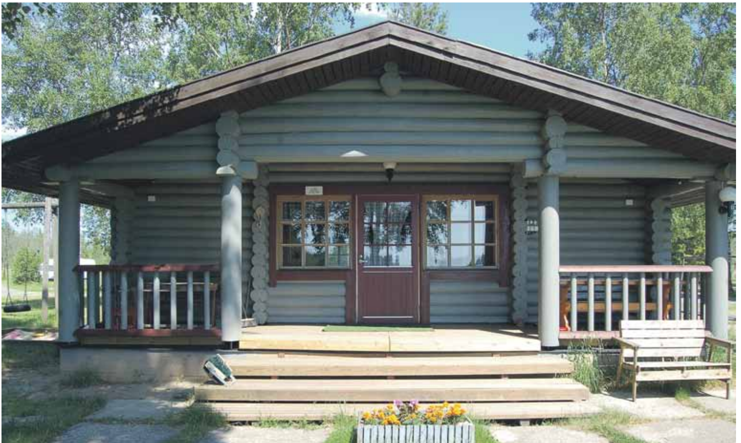
Päämökki, joka on vuokrattavissa viikoksi kerrallaan aloitus Su klo: 16.00 ja lopetus Su klo: 14.00.